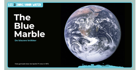
Slide 2, The Blue Marble.

Weet je nog? Dit is de eerste foto van de aarde vanuit de ruimte. De astronauten waren helemaal betoverd door onze mooie, kwetsbare wereld. We zijn ruimteschip aarde, een prachtig eiland in de ruimte. Pampus in het groot!