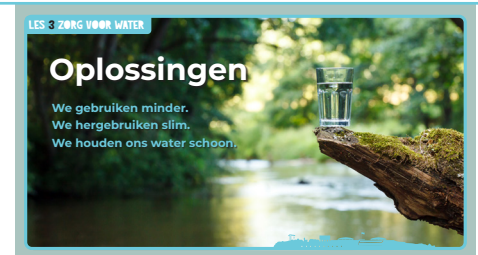
Slide 3, Het water op aarde