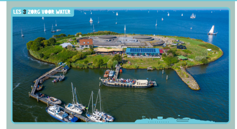
Slide 1, Dat was Pampus.

Even terugkijken. Wat ze op het moderne Pampus doen lijkt op wat ze doen in het ISS. Ze kunnen extreem goed met water omgaan. Ze zorgen met hun onderzoek voor een schoon en eerlijk systeem. En alle aardbewoners kunnen daarvan leren.