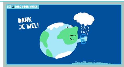
Slide 8, Aarde.

Bedank de kinderen voor hun creativiteit. Benoem dingen die je zijn opgevallen. Wat gaan jullie in de klas nu anders doen? Eindig positief!