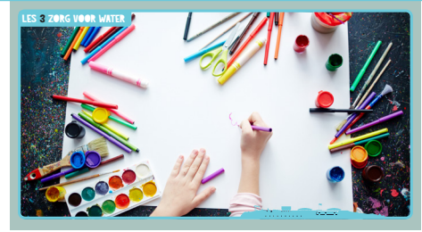
Slide 7, Forteiland Pampus.

Maak van de tekeningen een tentoonstelling in de klas. Pampus is ook heel benieuwd naar wat jullie hebben bedacht! Laten jullie het ons weten via info@pampus.nl ?