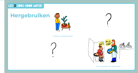
Slide 5, Hergebruiken.

Wat kunnen jullie nog meer bedenken? Stimuleer wilde ideeën! Er mag gelachen worden. Doe weer een kort rondje om de ideeën van de leerlingen op te halen.