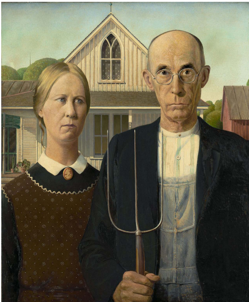
Bron: Grant Wood

Nike gebruikt storytelling in hun reclames niet alleen om hun spullen te verkopen, maar ook om aandacht te vragen voor maatschappelijke zaken zoals kansengelijkheid en je dromen waarmaken: Just do it!